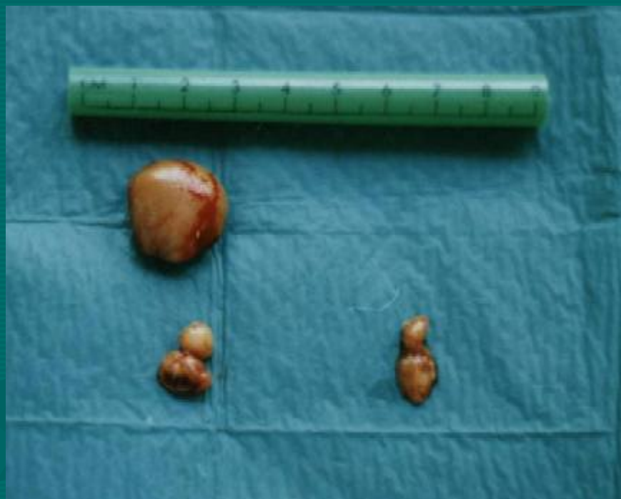
Makropreparat hirurški odstranjenih uvećanih paratireoidnih žlijezda.

Sekundarni HPT nastaje kao posljedica nekog drugog oboljenja ili stanja koje dovodi do sekundarne stimulacije paratireoidnih žlijezda /bubrežna insuficijencija, osteomalacija/