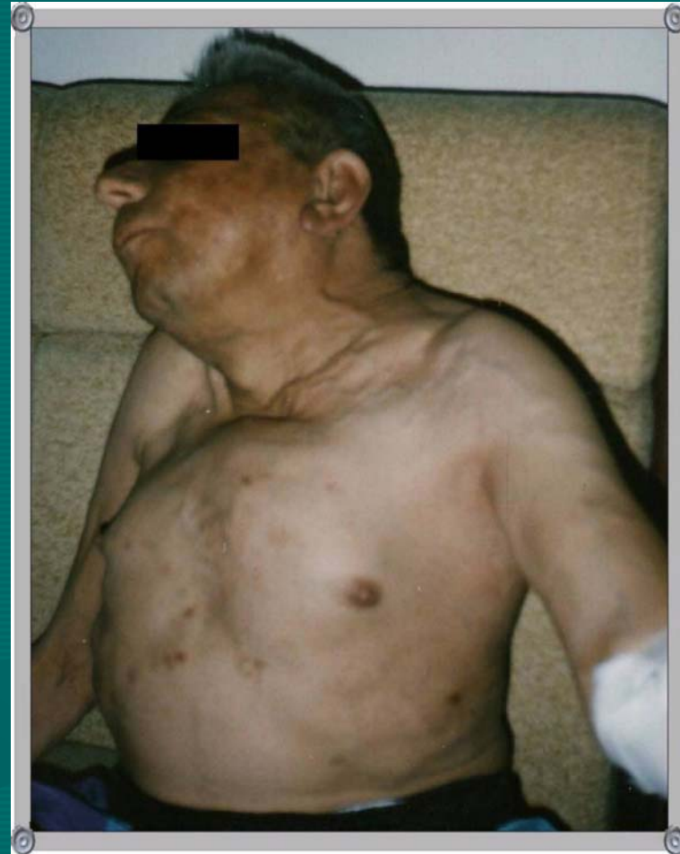
Izraženi deformiteti grudnog koša u pacijenta na dugogodišnjoj hemodijalizi.

Najizraženije promjene se vidaju na skeletu, a skoro svi sistemi mogu biti zahvaćeni.