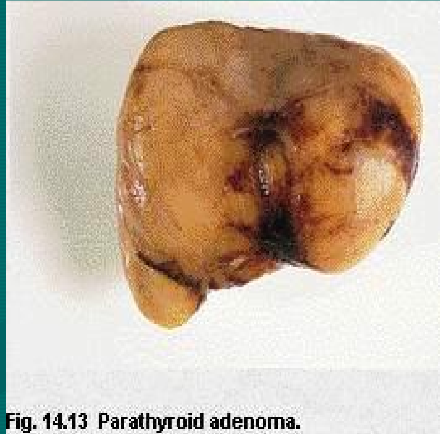
Fig. 14.13 Parathyroid adenoma.